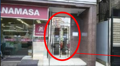
ビル入口 (日比谷通り沿い)