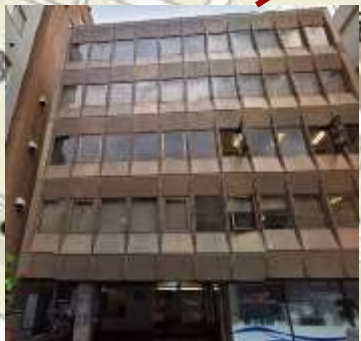
都営地下鉄、東京メトロの飯田橋駅C1出口を出て左手セブンイレブンやドトールがある方向へ進み、角を左折、2つ目の茶色の新陽ビル4階が会場です

JR線飯田橋駅 東口出口をパン屋がある左手に進み、歩道橋の下をくぐると信号があるので直進。信号向かい側に富士そばが見えてくるので、その奥茶色い安田ビルを左手に大久保通りを直進。ドトールの角を左折し、2つ目のビルが会場となります