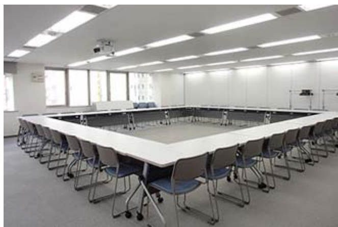
イオン名古屋 RoomA+B (写真は口の字54席の場合)