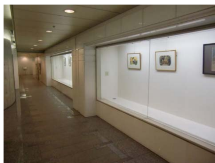
エレベーターへの通路、 7階へお上がりください