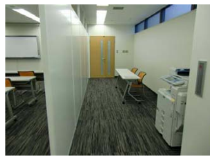
セミナールーム入り口 (内側からの写真)