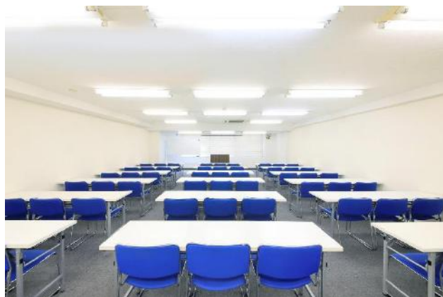
窓換気が可能な会議室です ※ご利用終了時には必ずお閉めください