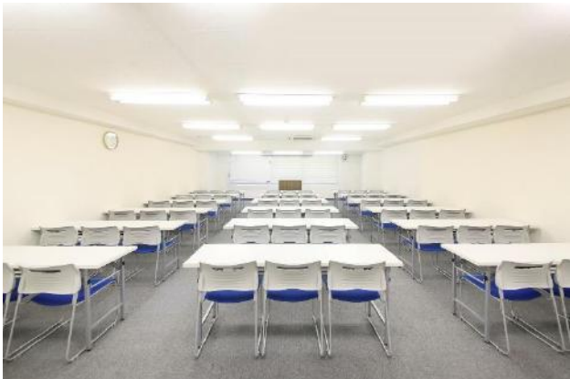
窓換気が可能な会議室です ※ご利用終了時には必ずお閉めください