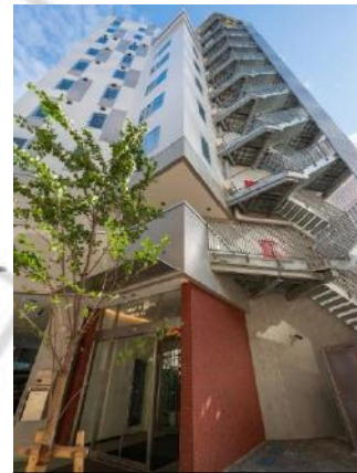
リロの会議室 池袋