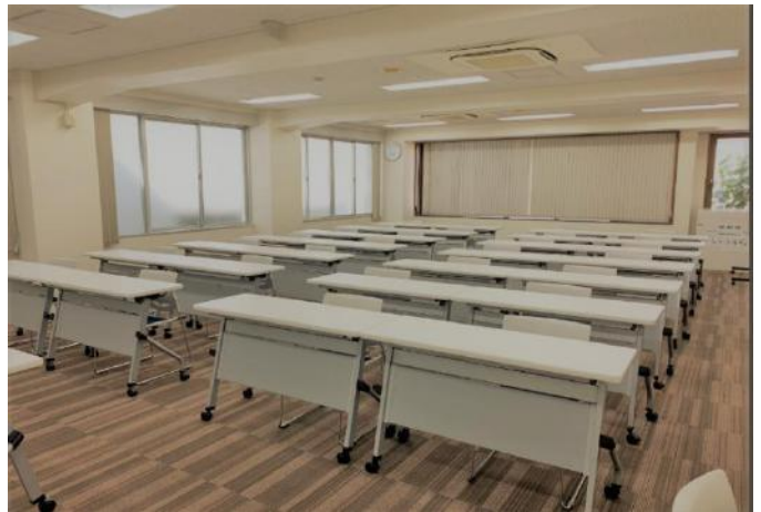
窓換気が可能な会議室です ※ご利用終了時には必ずお閉めください