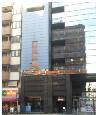
オーイズミビル外観