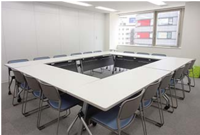
イオン名古屋 RoomD (写真は口の字18席の場合)