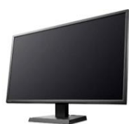
大型モニター (会場により異なる)