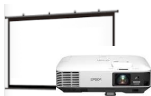
プロジェクター&スクリーン