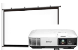
プロジェクター スクリーンセット