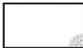
ホワイトボード投影機 (一部会場のみ)