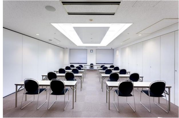
スクール2名掛けのイメージ

窓換気が可能な会議室です ※第1会議室は窓換気できません ※ご利用終了時には必ずお閉めください