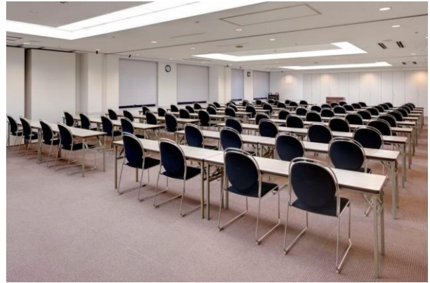
2名掛けのイメージ