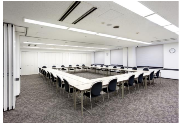
□の字2名掛けのイメージ