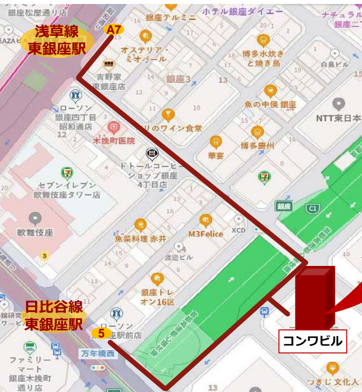
東銀座駅からお越しの場合