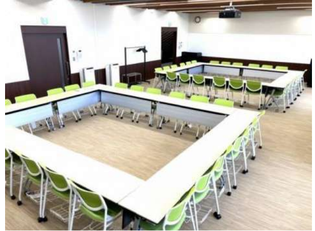
窓換気が可能な会議室です ※ご利用終了時には必ずお閉めください