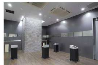
地下1階喫煙スペース