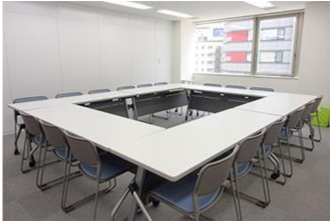
イオン名古屋 RoomD (写真は口の字18席の場合)