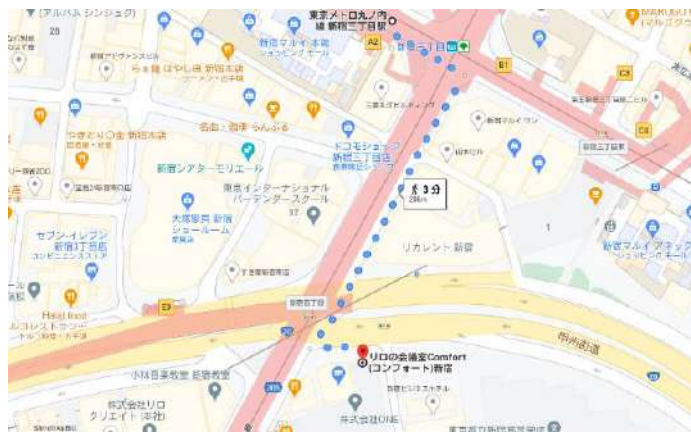
副都心線 新宿三丁目駅 E5出口からの経路