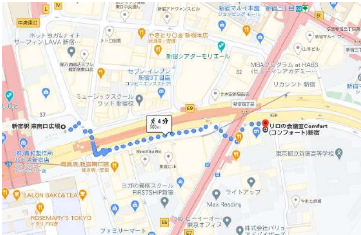
JR新宿駅 東南口からの経路