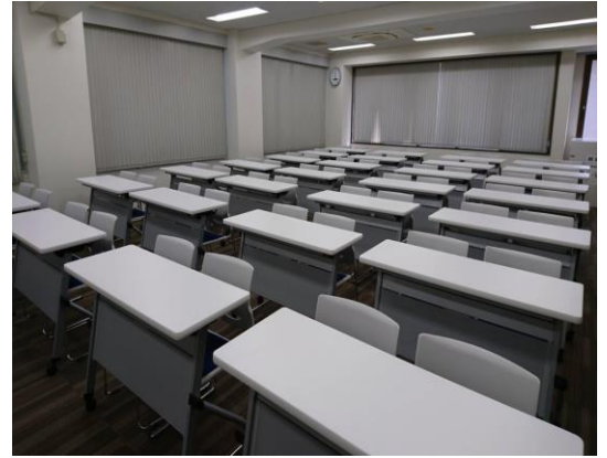
窓換気が可能な会議室です ※ご利用終了時には必ずお閉め下さい