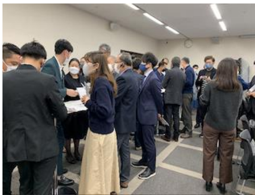
【ビジネス交流会の様子】